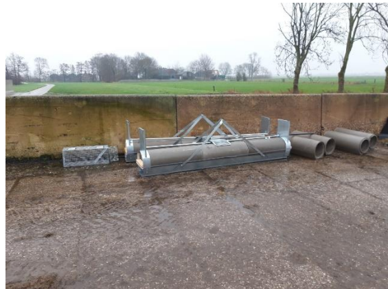
Vangkooien voor vossen

Predatie lijkt minder geweest te zijn. De WBE doet zeer goed werk. Zonder de WBE kunnen we het wel schudden, is het dweilen met de kraan open. Sjapoo !!